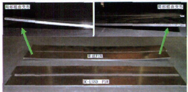
图1 DC-LSND与常规FSW焊后变形比较

DC-LSND FSW与常规FSW焊缝氢含量的对比分析表明,5A06铝合金母材中氢含量为0.002350% (相对质量分数),常规FSW焊缝中氢含量为0.002349%,而采用DC-LSND方法获得的FSW焊缝中氢含量为0.002350%。可见,阵列射流冲击热沉系统对搅拌摩擦焊具有较好的工艺适用性,