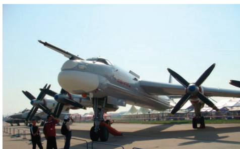
图6 图95固定式受油装置(机头)

固定式受油装置的优点是结构简单、质量轻、易于布置、拆卸容易,这些优点使得固定式受油装置成为最早使用的受油方式,并获得了广泛应用,其主要用在大型飞机(图95(图6)、A-400M(图7)、E-3、A-50)、飞行速度较低的飞机(幻影-5/50、掠夺者、流星、F-100(图8))及定型飞机加装空中受油装置(歼8、歼10(图9))。但飞机安装固定式受油装置会在飞行中带来气动噪声及产生结构振动,产生飞行员无法忍受的噪声,不仅对飞行员的无线电通话产生严重干扰,还影响了飞行员作战或训练时的注意力;另外也不利于飞机隐身。国内罗