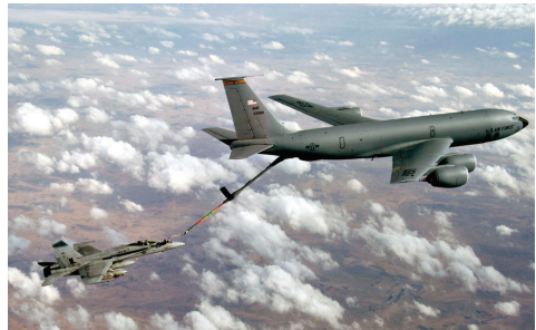
图4 软管-锥套适配器 Fig.4 Hose-and-drogue adapter

伸缩套管式加油方式(图 5)是指使用一根飞行可控的伸缩式硬质套管,由一名操作员控制其舵面,使硬管处于受油机上方,伸长套管的内管并将加油嘴插入受油机的受油插座的加油方式。