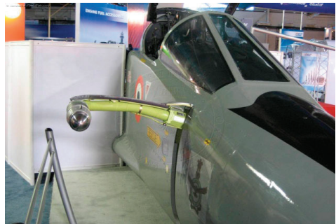
图14 美洲虎摇臂式受油装置(座舱右下方) Fig.14 Fuel receiving device by rocker of Jaguar (lower right of the cockpit)