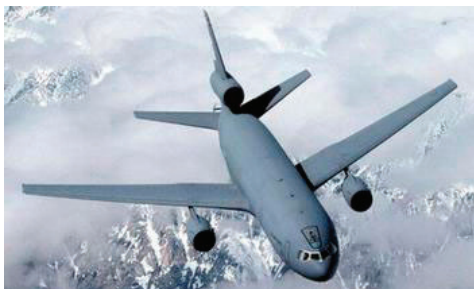
图16 KC-10受油插座(座舱上方)