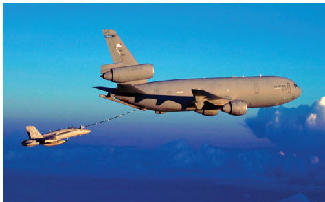
图3 机身中心线加油平台 Fig.3 Refueling store along fuselage centerline