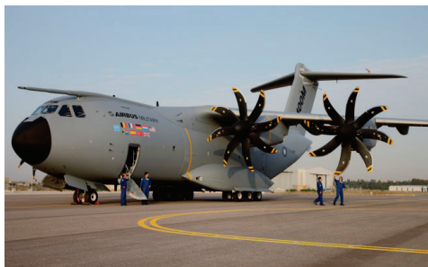
图7 A-400M固定式受油装置(座舱上方)