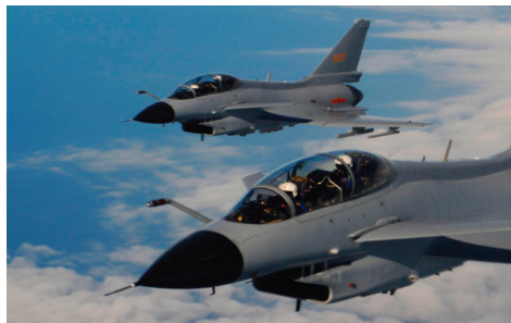
图9 歼10固定式受油装置(座舱右前方)