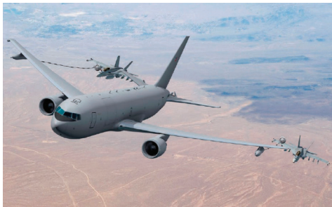
图1 翼下加油吊舱 Fig.1 Refueling pod under wing

与软管-锥套式加油方式对应的软式受油方式主要以固定式受油装置和可收放式受油装置为代表。