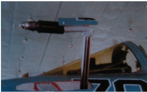
图11 Su-33伸缩式受油装置(座舱左前方) Fig.11 Retractable fuel receiving device of Su-33 (left front of the cockpit)