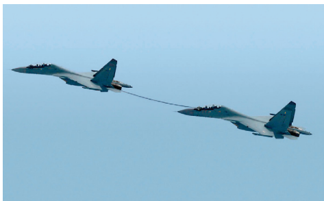
图2 伙伴加油吊舱 Fig.2 Buddy-buddy refueling pod