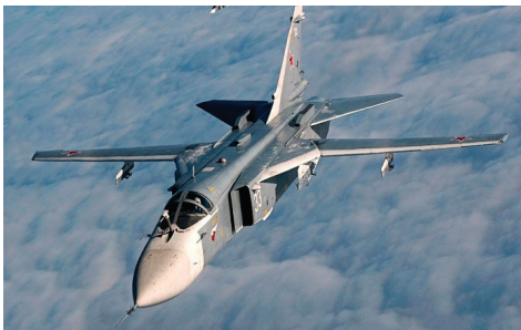
图10 Su-24伸缩式受油装置(机头) Fig.10 Retractable fuel receiving device of Su-24 (nose)

可收放式受油装置按收放方式一般分为伸缩式受油装置和摇臂式受油装置,其中伸缩式受油装置的收放方式类似于液压作动筒的直线运动,主要是 Su-24 (图 10)、Su-33 (图 11)、Su-35、MIG-29、MIG-31、F-16 (图 12) 等型号战斗机中采用或装在机翼外挂油箱上使用,其收放式受油探管组件内部集成了液压作动系统、锁紧机构、燃油通道等功能部件,具有集成度高、占用机体空间少、便于维护的优点,适合于新研飞机或定型飞机增加受油能力;缺点是制造精度高,加工较困难;另外其为半封闭结构,影响了隐身性能。