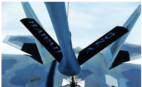
图5 伸缩套管式加油方式 Fig.5 Refueling method by boom

伸缩套管式加油方式的主要优点是:加油速度快,明显优于加油吊舱和机身中心线平台,为大型飞机(受油能力强)加油时效率很高;硬管的可控性好、抗湍流干扰性强,能够在较复杂的气象条件下使用;由加油机控制加油过程,对受油机飞行员的技能要求较低。伸缩套管式加油方式的主要缺点是:只能进行单点加油,不能同时为多架受油机(与受油机尺寸大小无关)加油,为受油能力弱的小飞机加油时,加油速度快的优势难以有效发挥;对加油员的操作技能和动作规范要求高;不能用于舰载机伙伴加油及为直升机、倾转旋翼机加油。