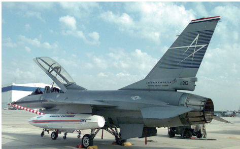
图12 F-16伸缩式受油装置(机翼外挂油箱) Fig.12 Retractable fuel receiving device of F-16 (external hanging tank of wing)

摇臂式受油装置的收放方式是利用摇臂围绕定点做上下运动,主要是“狂风”(Tornado)(图 13)、F-14、F/A-18、美洲虎(图 14)等型号战斗机使用。摇臂式受油装置和伸缩式受油装置的区别主要体现在结构的详细设计和布置上。摇臂式受油装置的液压作动系统与燃油通道在结构上进行了分离,无需担心燃油和液压油的交叉污染,且锁紧机构为开放式,其设计相对简单,便于制造和调节,易维护,故适合新研飞机采用,特别是可以做成全封闭结构,便于实现隐身功能;缺点是占用机体空间纵向距离较长,涉及飞机机体改动较大,不利于已定型飞机改装。