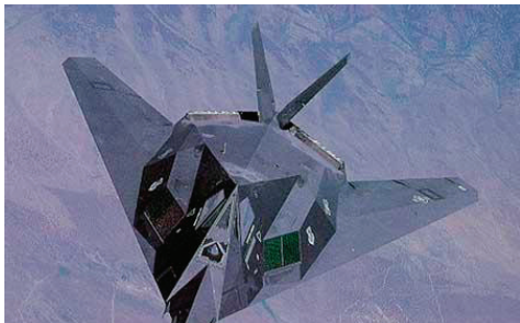
图15 F-117受油插座(座舱前方)

受油插座一般安装在飞机座舱前方、座舱顶部、座舱后部、机翼等位置的机体内(图 15~18),主要由壳体、锁紧机构、自封活门和通信线圈等部分组成,用于实现硬式空中加油空中对接、提供燃油流道和加受油机之间通讯等功能,其工作原理是加油机加油接嘴插入受油机