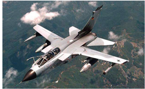
图13 狂风摇臂式受油装置(座舱右前方) Fig.13 Fuel receiving device by rocker of Tornado (right front of the cockpit)

摇臂式受油装置的收放方式是利用摇臂围绕定点做上下运动,主要是“狂风”(Tornado)(图 13)、F-14、F/A-18、美洲虎(图 14)等型号战斗机使用。摇臂式受油装置和伸缩式受油装置的区别主要体现在结构的详细设计和布置上。摇臂式受油装置的液压作动系统与燃油通道在结构上进行了分离,无需担心燃油和液压油的交叉污染,且锁紧机构为开放式,其设计相对简单,便于制造和调节,易维护,故适合新研飞机采用,特别是可以做成全封闭结构,便于实现隐身功能;缺点是占用机体空间纵向距离较长,涉及飞机机体改动较大,不利于已定型飞机改装。