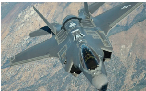
图17 F-35受油插座(座舱后方)