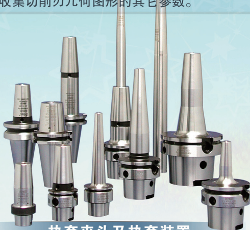
热套夹头及热套装置

KALiMAT A/S配备了可回转的第二个摄像头，利用反射光技术可得到透射光无法测量的刀具几何形状。放大50倍后，最小的不平度也可暴露于光线之下，这对刀具检测极为重要。相机可以从-90度旋转到90度，提高了CNC机床磨削刀具的检测效率，并可收集切削刃几何图形的其它参数。