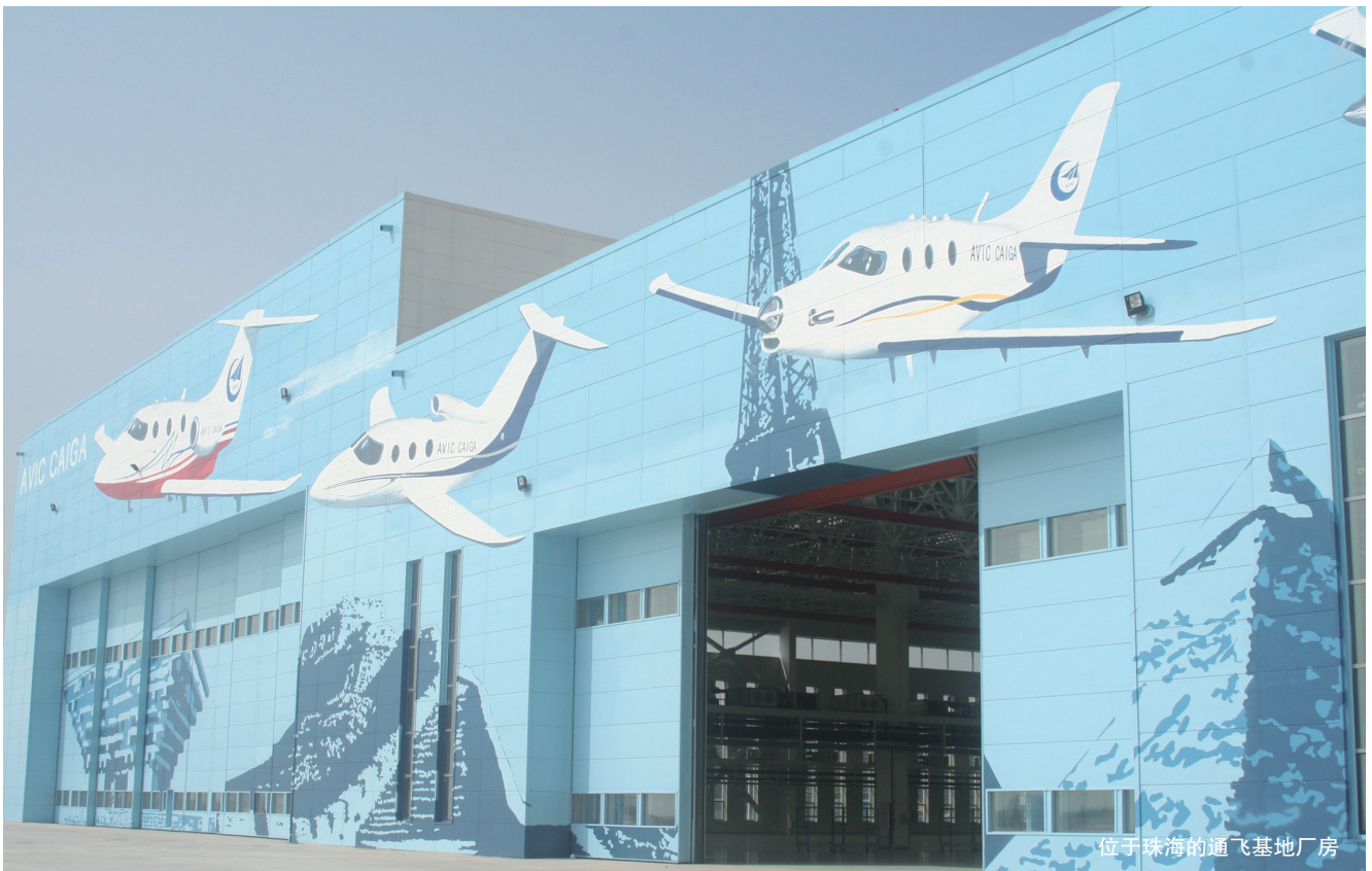
位于珠海的通飞基地厂房

源,加快打造完整的通用航空产业链。一要沿着产品链延伸。在抓好产品的研发、制造的同时,重视发展维修、保障和任务功能系统。二要沿着产业链延伸。根据市场需求,整合或新建有带动力的通用航空运营企业,开展通用航空运营业务。同时,积极进入运营支持、服务保障等领域,包括通用航空固定基地运营商(FBO)、飞行服务站(FSS)、机场建设、气象、备件、培训、酒店等业务,并努力打造通用航空“4S”店。我们正抓紧洽谈,计划在广东开展FBO和FBS试点,取得经验后在全国推广。三要沿着能力链延伸。在集团公司现有专业的基础上,面向全球市场,积极培育锻造、铸造、紧固件、元器件、液压件等专业化供应商,支持通用航空制造业发展。四要沿着价值链延伸。为通用航空产业提供融资、租赁等金融服务。通过努力,使集团公司成为国内领先、国际知名、拥有自主知识产权的通用飞机制造商、运营商