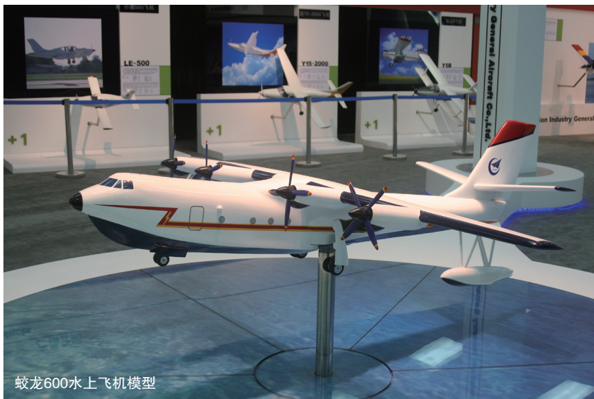
蛟龙600水上飞机模型