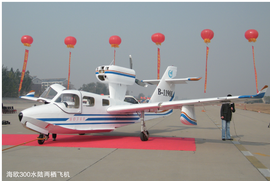
海欧300水陆两栖飞机