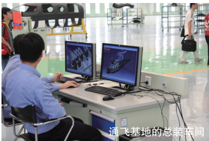
通飞基地的总装车间

团公司责无旁贷。中航工业要加强与其他部门的沟通、交流和配合,积极参与相关工作,在完善通用航空产业发展政策、加快低空空域管理改革等多方面做出贡献。在完成航空重点型号任务的同时,大力发展通用航空制造业,为迎接通用航空产业发展高峰的到来做好准备。通用飞机公司作为发展通用航空产业的责任主体,下一步要以珠海基地为重点,统筹好安顺、荆门、石家庄、贵阳、汉中产业基地建设,整合集团内部通用航空制造业资源,通过跨国并购增强核心能力,形成轻型活塞、多用途涡桨、喷气公务机、水上飞行器和浮空器等通用飞行器系列化发展的格局;要积极从制造业进入运营服务业,坚持全产业链、全价值链发展,率先使用国产飞机进行通航运营服务,积累使用和运营通用飞机的经验,促进低空空域管理改革和通航基础设施完善,为通用航空市场加速发展创造条件。