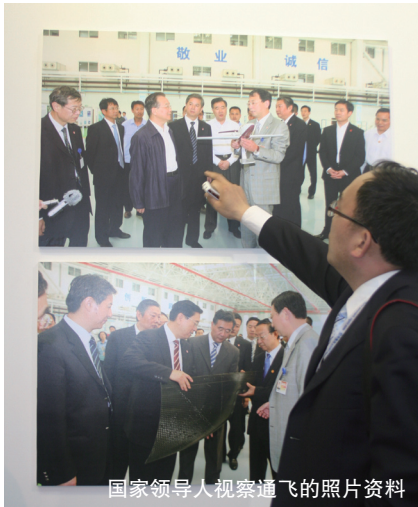
国家领导人视察通飞的照片资料