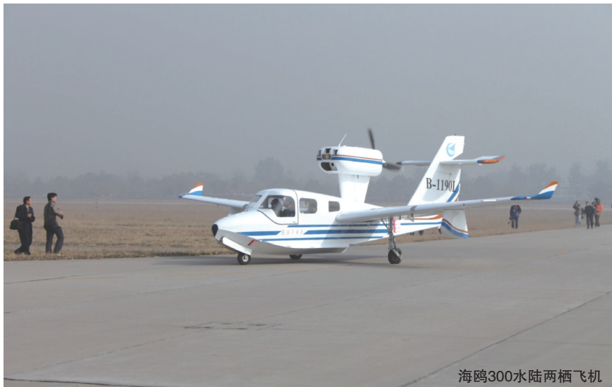
海鸥300水陆两栖飞机

(2) 基于模型定义 MBD 技术的应用,使 MBD 数据从上游至下游得以无缝传递,即用产品定义数据直接来驱动所有的数字化加工和测量设备直至飞机装配、维修和服务,但受国内数字化加工、数字化测量以及数字化装配技术应用深度和广度所限,基于 MBD 的先进数字化定义技术难以发挥最大的整体效益。