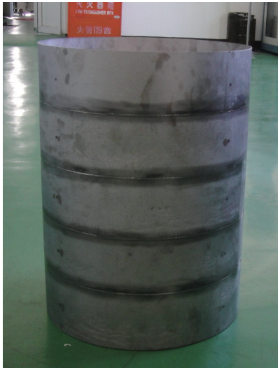
图6 Ti750舱段模拟件 Fig.6 Simulation section of Ti-750 alloy cabin

Ti750合金还具有较好的可焊性。本课题研究了该合金的电子束焊、激光焊、氩弧焊成形。结果表明:该合金具有很好的可焊性 [6] ,激光焊与电子束焊接,其焊缝强度可以达到母材强度,氩弧焊的焊缝强度也可以达到母材强度的80%,焊接后的延伸率最高可达到10%。此外,该合金还具有较好的扩散连接性,因此可成形该合金的复杂结构件。图6为超塑与激光焊成形的舱段模拟件,零件通过了静热联合试验考核。