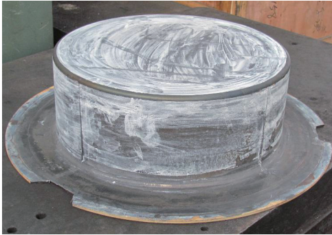
图5 Ti750超塑成形筒形件 Fig.5 Super-plastic formed Ti-750 cylinder piece

规则的圆截面舱体类零件,还能成形其它不规则的结构件。因此,对该新型合金开展超塑成形的深入研究,作为新材料的工艺技术积累与储备,为弹体结构件的需要奠定了更实用的基础。图5为超塑成形工艺样件。