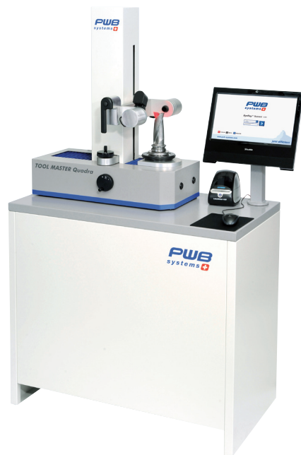
TOOL MASTER QUADRA