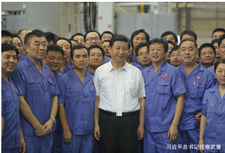
习近平总书记视察武重

需求,高端需求呈增长趋势。以上这些都说明:国内机床行业的市场需求发生了很大的变化,而且变化是多方面,反映的最直接特征就是需求总量减少,需求结构上升。