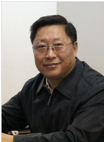
陈惠仁 中国机床工具工业协会常务副理事长兼秘书长。