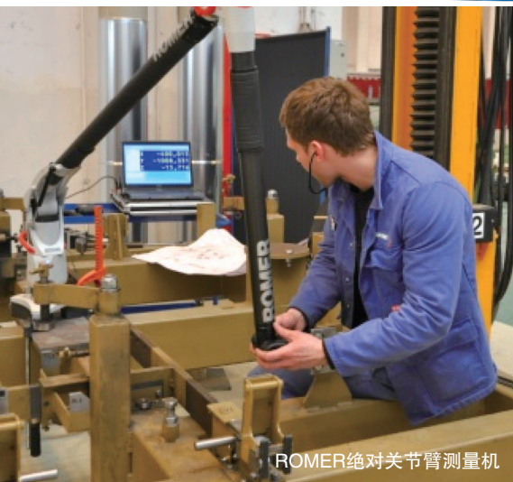
ROMER绝对关节臂测量机