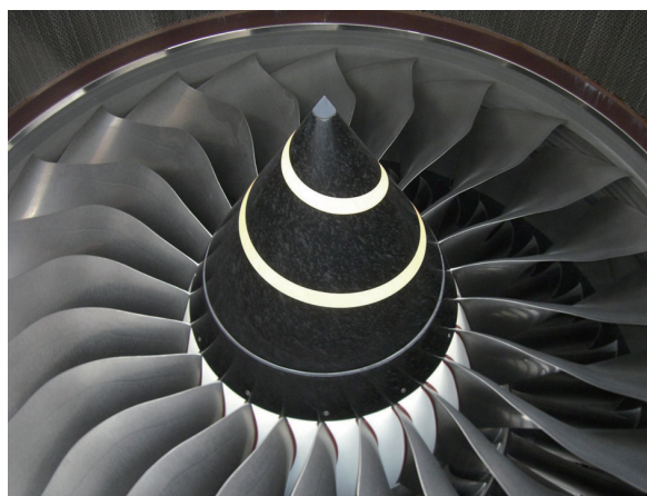
图1 航空发动机叶片

(3) 零件表面完整性程度直接影响到先进航空发动机的可靠性与使用寿命。高推重比航空发动机在可靠性设计方面,对关键零件的表面完整性要求更高。