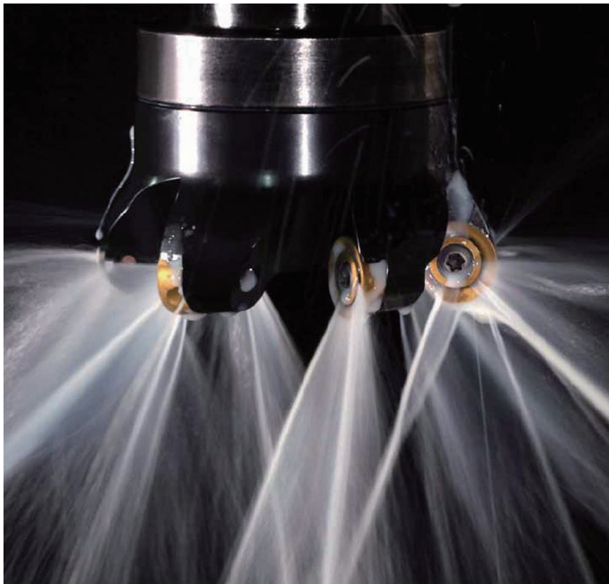
图4 高压内冷却铣刀

切削加工表面完整性技术是抗疲劳制造技术体系中最为重要的组成部分。从航空发动机的使用过程和故障分析得知,各种形式的疲劳破坏几乎都集中在零件的表面或接近表面的地方。当零件处于腐蚀介质和交变载荷的共同作用下,较差的表面完整性将会加快零件的疲劳破坏,降低零件的使用寿命。